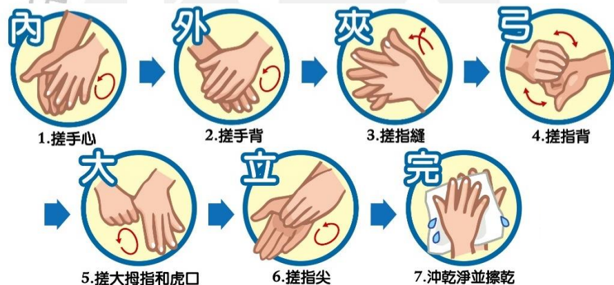
圖二、洗手 7 步驟