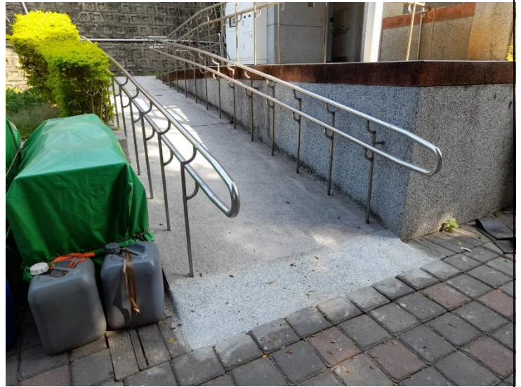
八卦山 1 號公廁旁輪椅坡道改善後 入口斜坡延伸順平