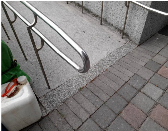
八卦山 1 號公廁旁輪椅坡道改善前 入口斜坡太陡